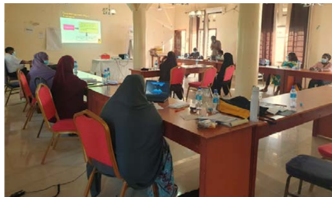
Personal de WPE que participó en la formación para la Atención clínica para sobrevivientes de ataques sexuales (CCSAS) en Dadaab 2021