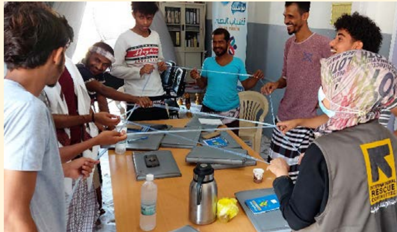
EMAP session for men in Yemen, 2021

“EMAP ha cambiado mucho la actitud y la conducta de los hombres en esta comunidad y eso ha hecho más fácil la vida de las mujeres. Muchos hombres se integraron después de que creamos conciencia por medio de una sesión de preguntas y respuestas en la radio donde educamos a los hombres que no han participado en el programa. Ya no seguimos la cultura ciegamente como antes. Dejen que nuestras niñas vayan a la escuela. Mi esposa dice que soy un mejor hombre”.