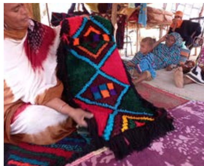
Una mujer en Mali, con una alfombra que hizo durante las sesiones para desarrollar habilidades

Mediante la participación de mujeres líderes que ya tenían experiencia en la prevención y respuesta a la VBG en entrevistas telefónicas, los equipos de WPE se enteraron del aumento de casos de VBG, de los obstáculos para el acceso a los servicios debido a las restricciones de movimiento impuestas por el gobierno, así como de los altos costos en el transporte y en la atención médica. Comprender las preocupaciones de las mujeres y las niñas al realizar regularmente auditorías de seguridad, sesiones para escuchar y al recopilar comentarios de las mujeres y las niñas a través de mecanismos establecidos por el IRC para hacer observaciones, ha contribuido a dar un mejor servicio a las mujeres y a las niñas durante la pandemia. La responsabilidad ofrece a las mujeres y a las niñas un espacio para expresar sus preocupaciones y recomendar cambios que promuevan su seguridad y empoderamiento.