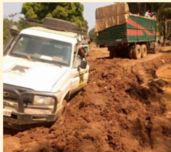
Personal de respuesta a la VBG de DRC trabajando pese a las difíciles condiciones del camino

El equipo de WPE de Tanzania enfrentó un reto particularmente fuerte para apoyar que las mujeres tuvieran acceso a ahorros y créditos para enfrentar dificultades económicas cuando el gobierno estableció una restricción a las actividades de la VSLA en los campos de refugiados. El IRC sigue abogando por solucionar este asunto y, mientras tanto, el personal de WPE sigue promoviendo actividades de empoderamiento alternativas para las mujeres y niñas de los campamentos de refugiados, además de enfocar sus esfuerzos en apoyar a mujeres de las comunidades anfitrionas en áreas aledañas a los campamentos con actividades de la VSLA que incluyen agregar un nuevo grupo piloto de la VSLA con niñas adolescentes de mayor edad.