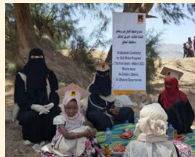
Actividades del equipo móvil de WPE de Yemen 2021

En Yemen, para ampliar el alcance, el IRC estableció cuatro equipos móviles de respuesta a la VBG integrados con los equipos móviles de atención médica del IRC. El personal móvil de WPE condujo sesiones para aumentar el conocimiento de la existencia de la VBG, los servicios de respuesta disponibles y cómo tener acceso a ellos, dejando claro que estos servicios están abiertos a todas las mujeres y niñas. También hicieron esquemas para ubicar a las comunidades y planificar la seguridad junto con mujeres y niñas para mitigar las inquietudes sobre seguridad y protección identificadas.