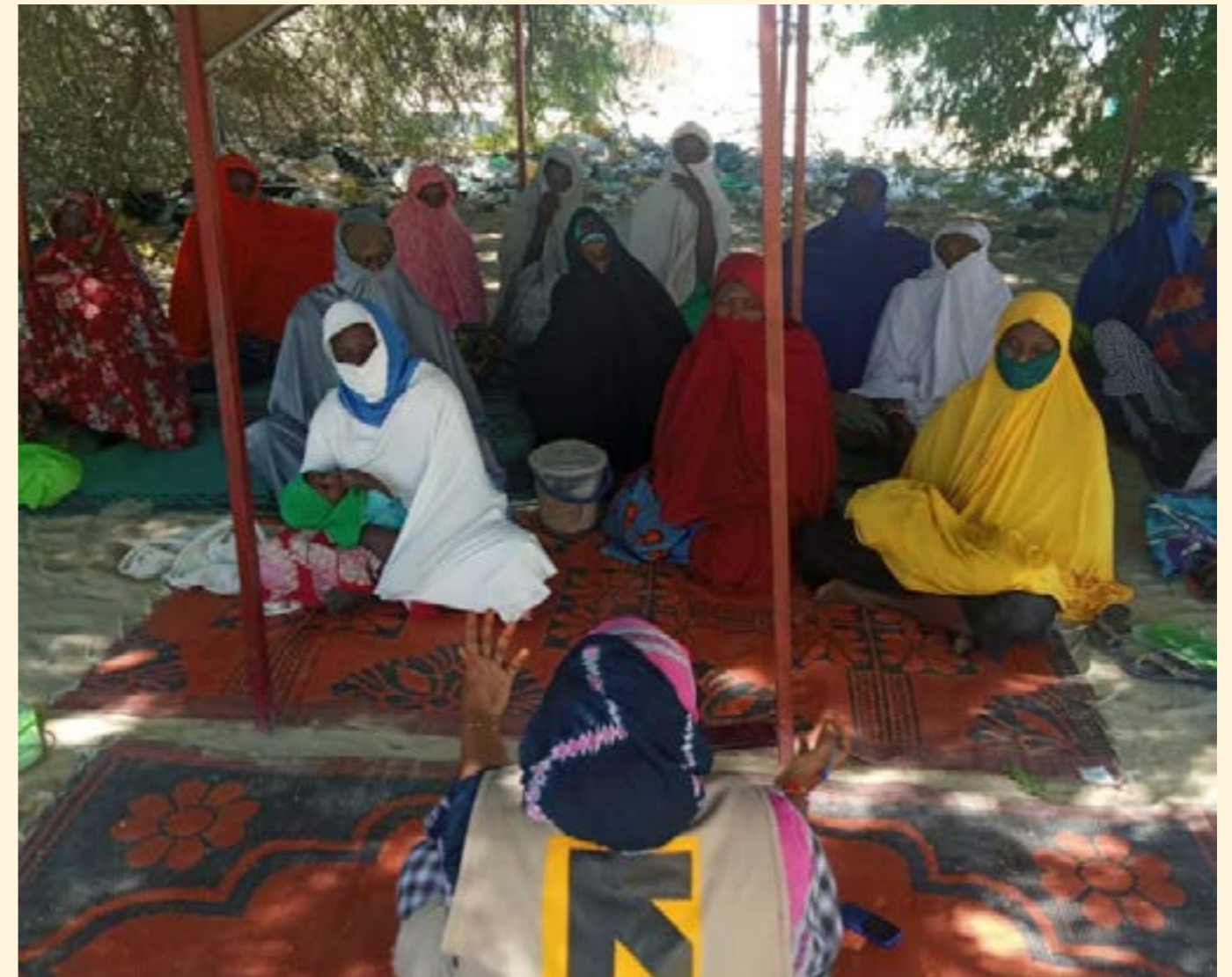
N'guigmi, sesión del grupo de mujeres de EMAP