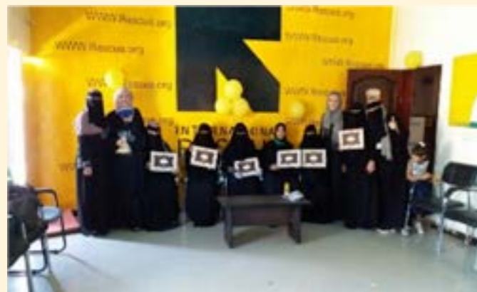
Mujeres graduadas de las sesiones informales de alfabetización impartidas por el programa de WPE de Yemen en 2021

El equipo de WPE en Yemen tuvo dos grandes éxitos en 2021 relacionados con la adaptación del programa. El primero fue que, en Al' Dhale, lograron obtener la cooperación de la oficina de educación del Ministerio de Educación para incluir su sello en los certificados de las mujeres y niñas que asistieron a los cursos de alfabetización informales del WPE. Esto se considera como uno de los mayores logros del WPE, no solo por el valor y el significado de entregar documentos con un sello oficial a las personas que atendemos, sino porque eso implica que el Ministerio reconoce los certificados como cualificación válida para quienes decidan continuar su educación más allá de las sesiones de alfabetización. El segundo gran éxito fue que el equipo ahora está empezando a llevar Girl Shine a las adolescentes en las escuelas con el apoyo de graduadas de Girl Shine como mentoras.