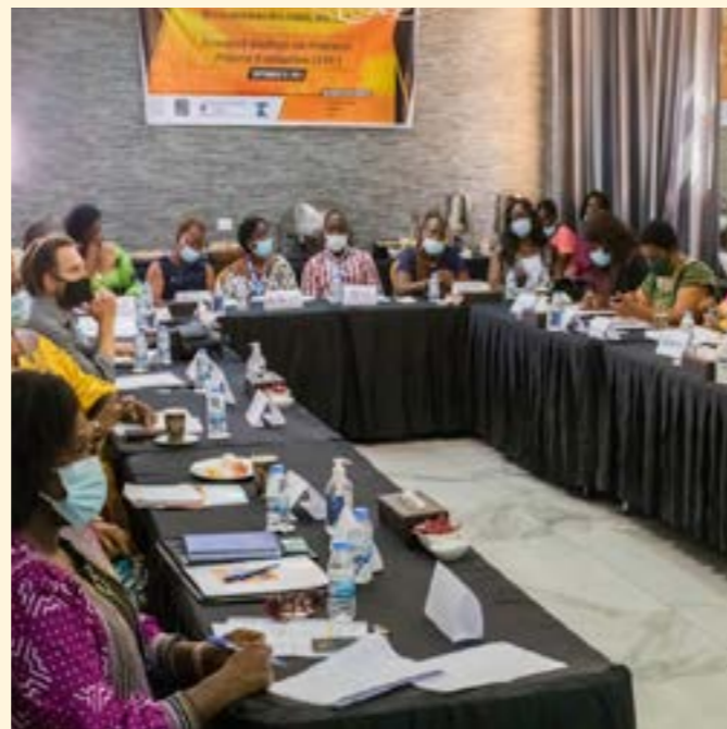
Evento de aprendizaje de la asociación feminista de WPE de Liberia, 2021

Hacer asociaciones diversas con feministas y organizaciones para los derechos de las mujeres fue una prioridad clave para el equipo de WPE de Liberia a medida que el IRC se retira gradualmente de la implementación directa de los servicios de prevención y respuesta a la VBG. El equipo de Liberia se relacionó con asociadas en un proceso de evaluación de la asociación feminista, financiado por Irish Aid, para capturar el aprendizaje obtenido en colaboraciones de asociación hasta la fecha e identificar los éxitos y los retos para sostener servicios de prevención y respuesta a la VBG de calidad en Liberia. Esto culminó en un evento de aprendizaje donde se presentaron recomendaciones clave para mantener un servicio de prevención y respuesta a la VBG sostenible. La Coalición de Mujeres contra la VBG en Liberia (COWAGIL), La asociación de Promoción de Mujeres y Niñas de Áreas Rurales y Solidaridad Femenina Incorporada (WOSI) dirigieron pequeñas organizaciones de rehabilitación de mujeres y compartieron la plataforma con el equipo de WPE del IRC. 'Los necesitamos a ustedes tanto como ustedes a nosotras' para terminar con la violencia contra las mujeres y niñas fue el mensaje clave emanado de la sesión, donde el aprendizaje esencial y llamado a la acción fue crear asociaciones igualitarias más fuertes y respetuosas al invertir en organizaciones que fortalezcan los derechos de las mujeres y las empoderen para que estén bien equipadas para sostener programas de calidad.