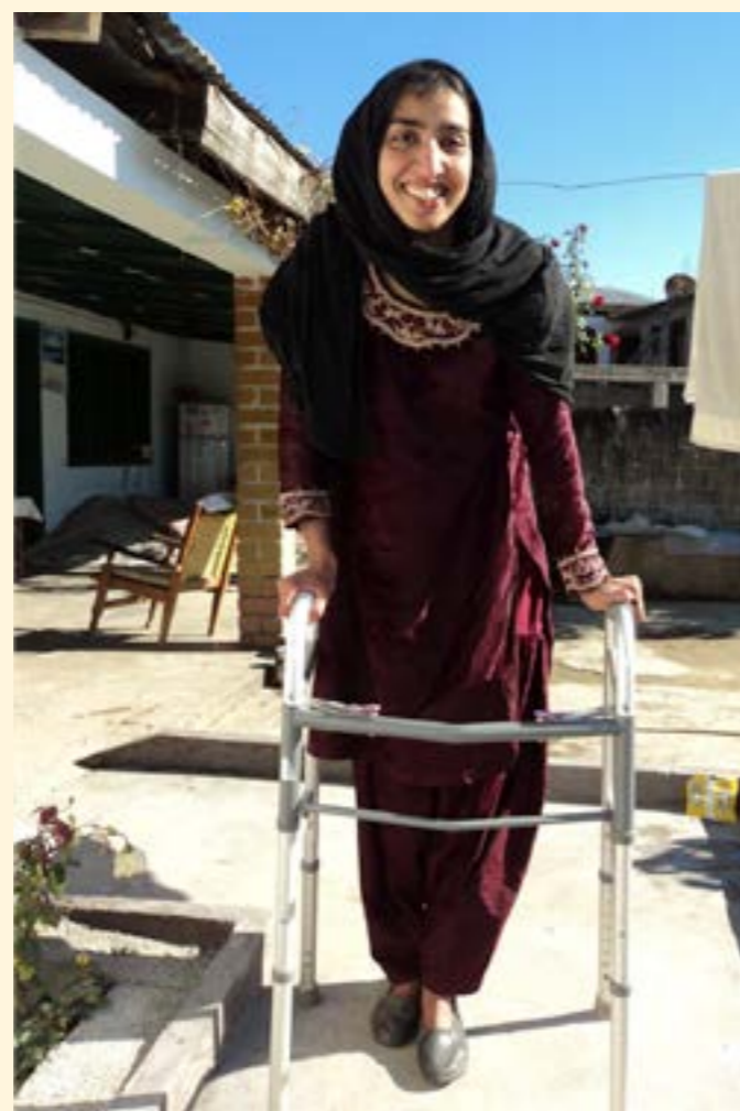
Foto: Niña con discapacidad, IRC Siria