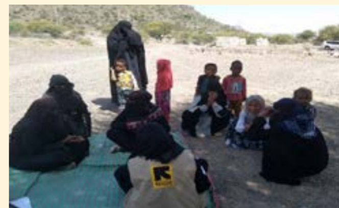
Actividades del equipo móvil de WPE de Yemen 2021

El IRC ha estado muy ocupado estableciendo programas de WPE en el estado de Gedaref, Sudán, durante 2021. Durante las discusiones comunitarias y la evaluación, quedó claro que las mujeres y niñas de los campos de refugiados y de la comunidad anfitriona tenían necesidades sin cubrir, y sin embargo, muchos actores se dirigían inicialmente solo a los que habían sido desplazados recientemente. El IRC reconoció esto y, al querer evitar tensiones, adoptó una estrategia proactiva, envió mensajes de alcance y sostuvo diálogos con todos los participantes clave para asegurarse de que entendieran claramente que los servicios de WPE del IRC se ofrecían a todas las mujeres y niñas, sin importar su condición, nacionalidad, orientación sexual, religión o edad. Por ello, el equipo de WPE del IRC se aseguró de que los comités de mujeres tuvieran representación tanto de las comunidades de refugiados como las anfitrionas y que ambas comunidades facilitaran las sesiones de habilidades para la vida para asegurar que todas las mujeres y niñas formaran parte del círculo que toma las decisiones. El equipo de WPE de Sudán también planea distribuir lámparas de energía solar a las mujeres y las niñas con discapacidad, con base en el descubrimiento de una evaluación entre instituciones participantes.