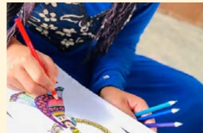
Niña adolescente participante de una sesión de Girl Shine en un espacio seguro facilitado por el programa de WPE del IRC en Líbano, 2021

Dadas las importantes presiones económicas que se ejercen sobre las mujeres y las niñas, los equipos de WPE de Líbano y Jordania han estado trabajando en su respuesta con base en las observaciones de las mujeres de ayudar con dinero en efectivo para su protección y aumentar el nivel de ayuda material