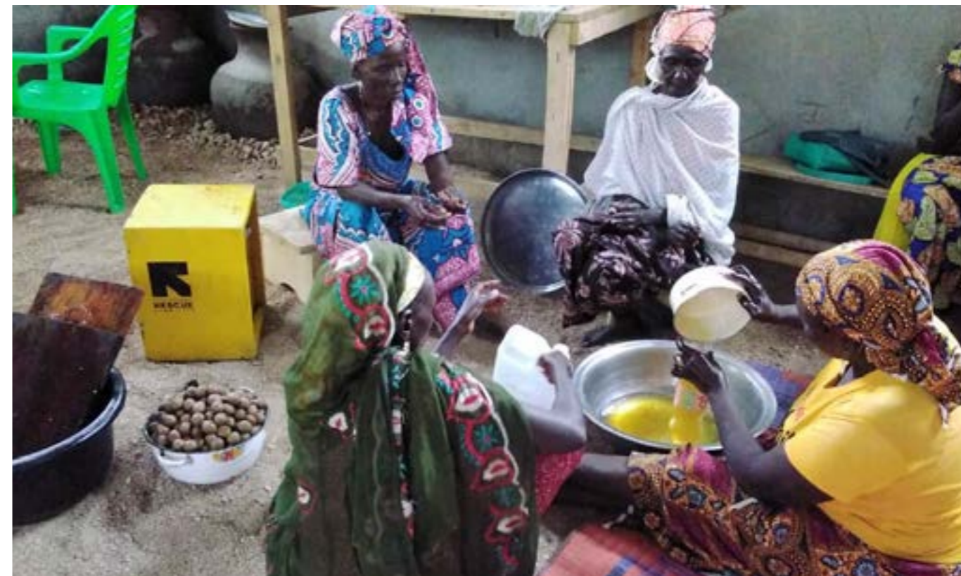
Mujeres de comunidades de desplazados y de la comunidad anfitriona trabajan hombro a hombro en pequeñas actividades generadoras de ingresos (extracción de petróleo) en Burundi

Con la pandemia actual de COVID-19, la necesidad de garantizar prácticas responsables para mujeres y niñas en las acciones de respuesta humanitaria se abordó por medio de una coordinación y colaboración más fuerte con otros asociados, entre ellos, redes de movimientos políticos de mujeres, asociados de gobierno y líderes del sector.