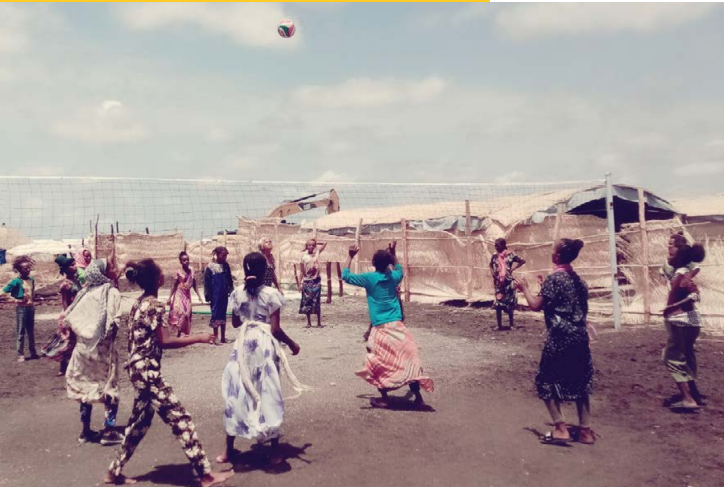
Mujeres y niñas del estado de Gedaref, Sudán, en una sesión de voleibol recreativo