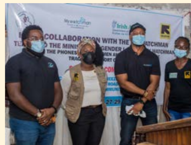
Evento de lanzamiento del piloto de la aplicación Mywatchman en Liberia

En el occidente de África, el equipo de Liberia también logró beneficiarse de la tecnología por medio de una asociación con una compañía privada, Watchman, y el Ministerio de Género para hacer una prueba piloto con la denuncia de un incidente de violencia de género utilizando la aplicación Mywatchman. En la fase de prueba participaron 150 mujeres y niñas.