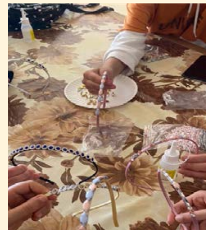
Niñas adolescentes haciendo bandas decorativas para la cabeza durante una sesión de habilidades para la vida en Libia

El equipo de WPE de Libia ha tenido éxitos clave en la generación de confianza y colaboración con las CBO locales; esto ha llevado a que se invite al IRC a realizar sesiones de concientización sobre la VBG para mujeres y niñas y que ellas tengan acceso a los puntos de servicio de estos actores, lo que ha dado como resultado un mayor alcance y conocimiento de los servicios de prevención y respuesta a la VBG a mujeres y niñas diversas. Las CBO también están apoyando los esfuerzos del IRC al apoyar las actividades de movilización de Girl Shine para promover la asistencia de niñas y adolescentes.