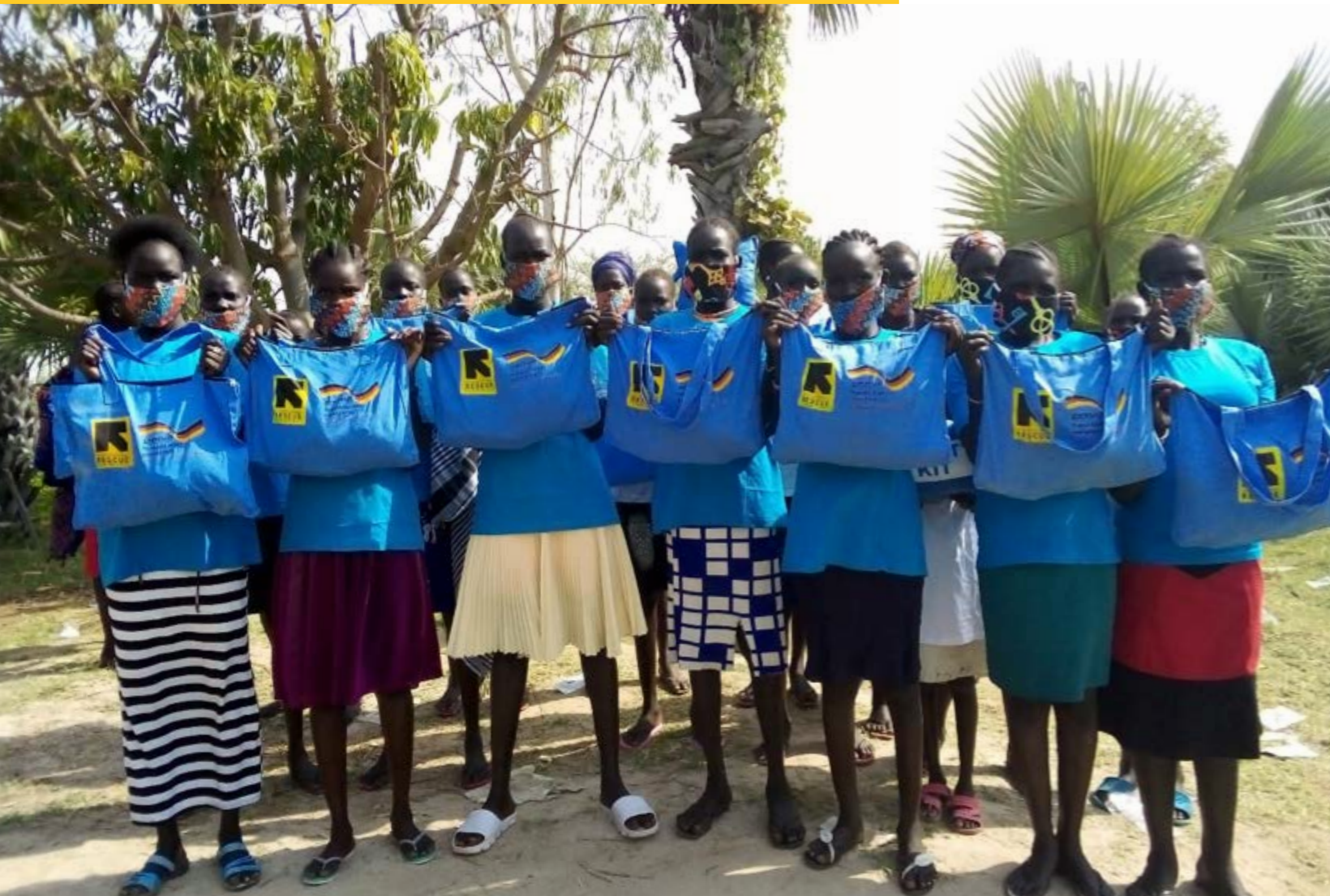
Niñas adolescentes en Sudán del Sur después de una sesión de habilidades para la vida donde recibieron kits de dignidad.