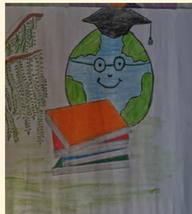
Dibujo de un participante atendido por el programa de WPE del IRC Libano en el Día Internacional de la Alfabetización

El equipo de WPE de Líbano celebró el Día Internacional de la Alfabetización el 8 de septiembre con actividades específicas para apoyar la inclusión de las mujeres y niñas con poca alfabetización o ninguna. Por medio de actividades básicas específicas de desarrollo, así como a través de sesiones de Girl Shine (por vía remota o en persona), las mujeres y las niñas tienen la oportunidad de desarrollar sus habilidades de lecto-escritura y numeración en un entorno de respaldo y reciben materiales y paquetes educativos y de PSS para impulsar su aprendizaje y desarrollo.