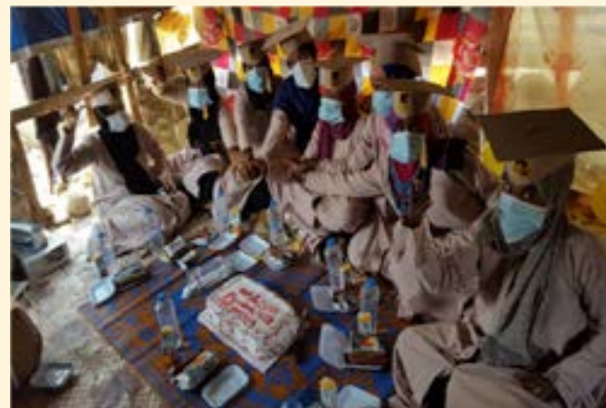
Niñas adolescentes de Yemen que terminaron con éxito su ciclo de habilidades para la vida de Girl Shine en 2021

El equipo de WPE de Tanzania enfrentó un reto particularmente fuerte para apoyar que las mujeres tuvieran acceso a ahorros y créditos para enfrentar dificultades económicas cuando el gobierno estableció una restricción a las actividades de la VSLA en los campos de refugiados. El IRC sigue abogando por solucionar este asunto y, mientras tanto, el personal de WPE sigue promoviendo actividades de empoderamiento alternativas para las mujeres y niñas de los campamentos de refugiados, además de enfocar sus esfuerzos en apoyar a mujeres de las comunidades anfitrionas en áreas aledañas a los campamentos con actividades de la VSLA que incluyen agregar un nuevo grupo piloto de la VSLA con niñas adolescentes de mayor edad.