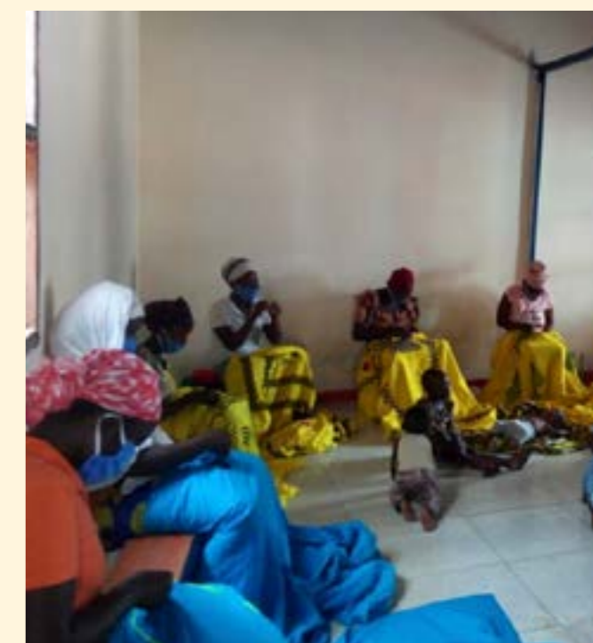
Mujeres y niñas en Gatumba, Burundi, participando en una sesión de bordado dentro del desarrollo de habilidades.

El equipo de Burundi, como parte de sus auditorías y monitoreos de seguridad de las tendencias y patrones de datos de la gestión de casos de VBG, identificó a las mujeres y las niñas con discapacidades como un grupo particularmente en riesgo y marginado. Algunas mujeres y niñas con discapacidad afirmaron sentirse estigmatizadas y excluidas de la sociedad y expresaron su deseo de estar más integradas y tener la oportunidad de conocer a más mujeres y niñas. El equipo de WPE del IRC, entonces, tomó medidas proactivas para asegurar que las mujeres y niñas discapacitadas (física o intelectualmente) fueran invitadas a participar en todas las actividades relevantes del espacio seguro y de que recibieran apoyo si enfrentaban obstáculos para participar. Por ejemplo, que recibieran dinero en efectivo para transportarse desde y hacia el espacio seguro.